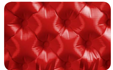
Door de vele Air Sprung Cells vormt de mat naar je lichaam

We hebben de 40D nylon face stof ontwikkeld om de balans te zoeken tussen gewicht en duurzaamheid. Tijdens het ontwikkelen, hebben we lichtere weefsels getest, maar we vonden deze te onbetrouwbaar voor een slaapmat. We hebben de stof zo sterk mogelijk gemaakt zonder een gram meer te gebruiken.