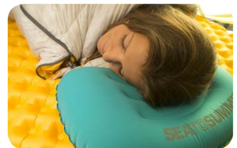
De meest comfortabele mat