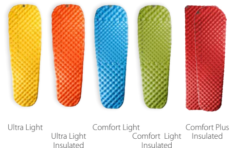
Ultra Light Ultra Light Insulated Comfort Light Comfort Light Insulated Comfort Plus Insulated

Sea to Summit heeft een slaapmat ontworpen die beter is dan het reeds beschikbare. 'Beter' is hierin natuurlijk een zeer subjectieve benadering: we zouden de lichtste hebben kunnen gemaakt, of de meest compacte mat ooit tevoren, maar we zijn eerst een stap terug gegaan. We zijn teruggegaan naar het waarom. Waarom hebben we een matras bij ons tijdens een outdoortrip? – voor een betere nachtrust. We presenteren met trots, naar wat wij beschouwen, de meest comfortabele slaapmatrassen op de markt. Slaap zacht!